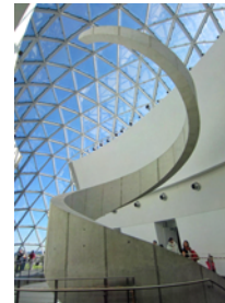
Detaljbild från invändig trappa

Dalí själv ville att ett sådant skulle finnas i New York, där han bott under många år. Många museer var intresserade men St. Petersburg erbjöd sig att bygga ett eget museum för samlingen och efter att byggnaden uppförts öppnades utställningen 1982. Denna byggdes senare till och 2011 öppnades ett helt nybyggt museum som rymmer ca 2 000 verk av Dalí. Den nya byggnaden är ritad av Yann Weumoth, som också ritat glaspysamiden utanför Louvren i Paris.