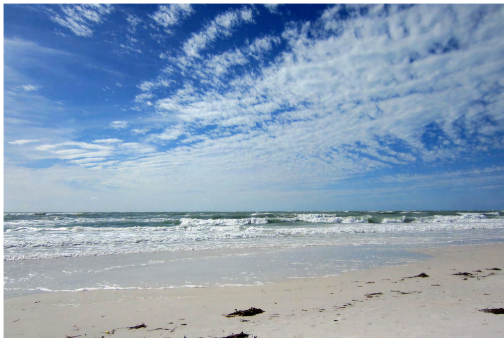
Promenad längs stranden vid Longboat Key en blåsig dag