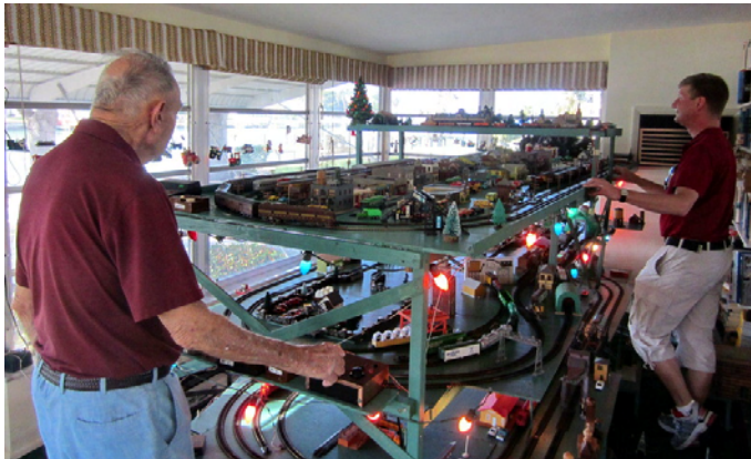
Man blir aldrig för gammal för att ha roligt!