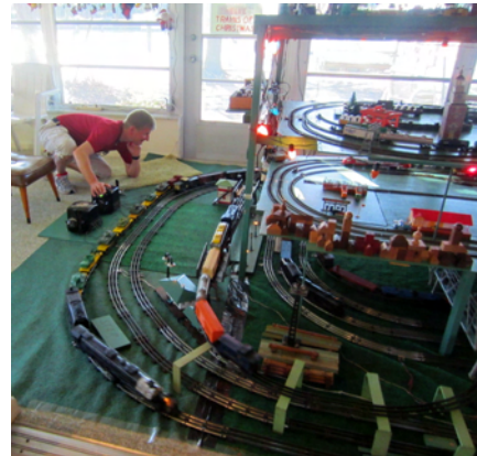
Tjugo år sedan sist!