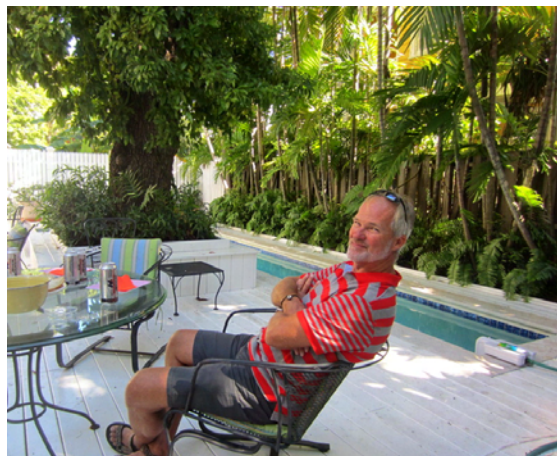
Kapten njuter i skuggan