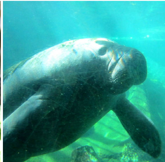
Så här ser en manatee ut!

När vi kom hem den dagen hade vår värdfamilj återvänt från Kalifornien och hämtat sin lagrade post. Där fanns även ett kvitto på vår ansökan om utökat uppehållstillstånd, I-94.