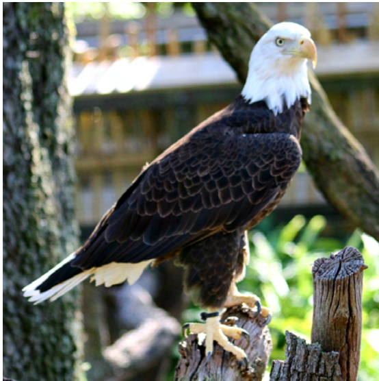
Symbolen för Amerika: Bald Eagle