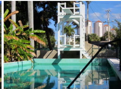
Mina Edison älskade sin pool

Edison var nära vän med Henry Ford som 1916 köpte grannfastigheten. Idag är hela anläggningen ett museum och man kan ströva runt i de vackra omgivningarna. Här finns också utställningar om Edisons 1 064 patent och ett laboratorium. Under andra världskriget sökte man alternativ till gummi så Edison, tillsammans med Ford och gode vännen Harvey Firestone, skapade 1927 detta botaniska laboratorium för att söka svaret på gåtan.