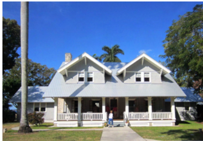
Här bodde familjen Ford