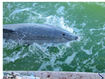
Kompis som följde oss länge

Som om det inte var nog var det med hjärtat i halsgropen vi fortsatte ut genom inloppet som sandats igen rejält. Djupet var mellan 6 och 2 meter och när grundlarmet skrek för 2 meter längst ut i rännan, i grov sjö, var det ordentligt nervöst ombord. Allt gick bra och vi kom fria.